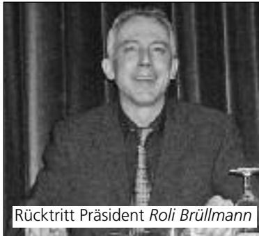
Rücktritt Präsident Roli Brüllmann