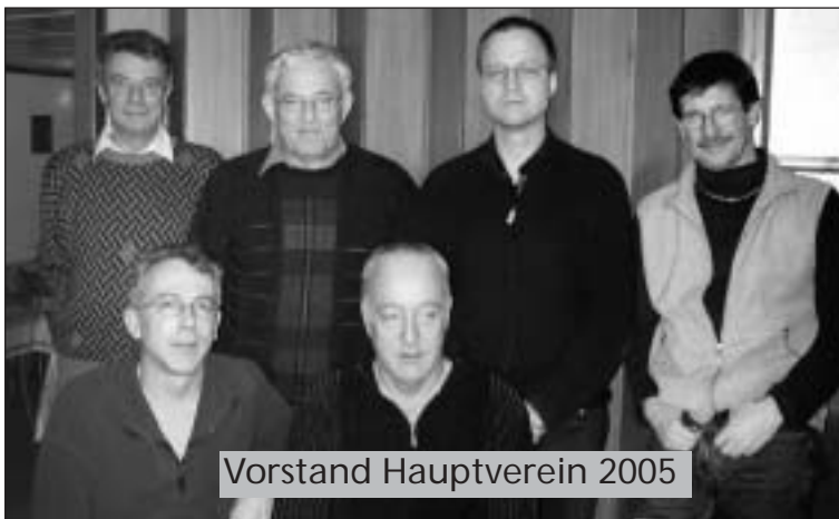
Vorstand Hauptverein 2005